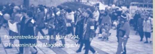
Frauenstreiktag zum 8. März 1994